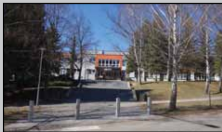
Palisády pred ZŠ M. Rázusa