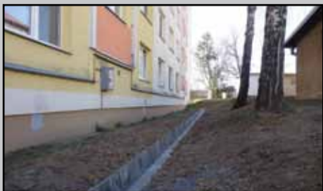
Rigol na Družstevnej ul.