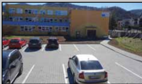
Parkovisko na ZŠ J. Alexyho