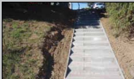
Schody na Brezovej ul.