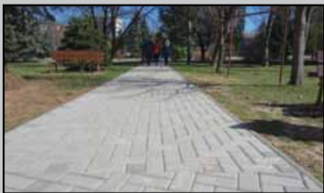
Chodník od Ul. Gen. Svobodu po domov dôchodcov