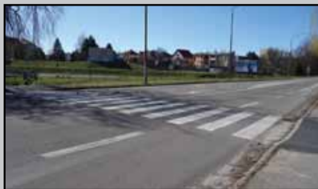
Znížený chodník na Ulici A. Hlinku