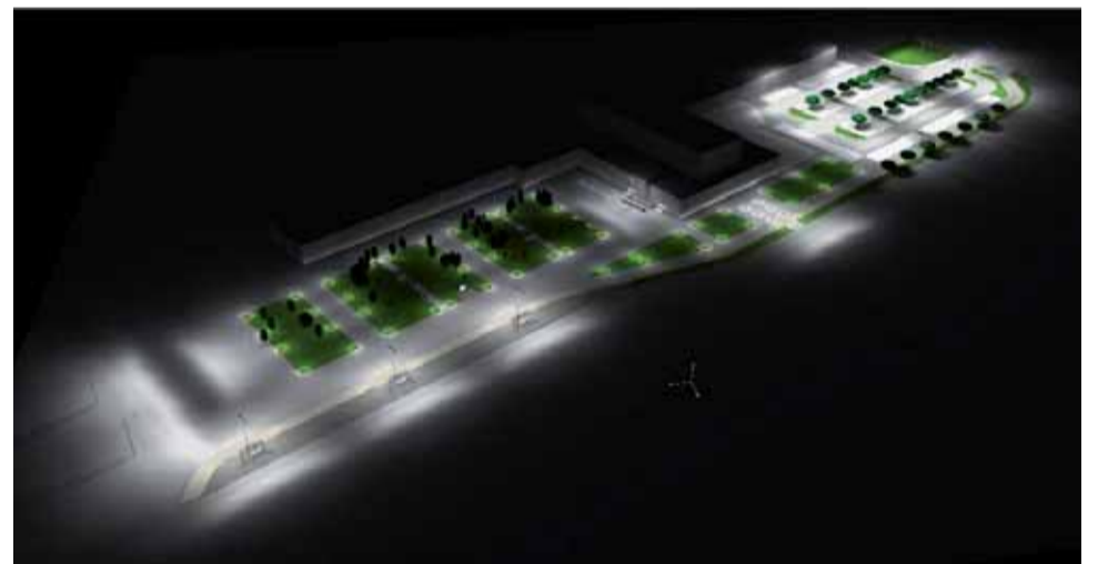
PRVOTNÁ VIZUALIZÁCIA MOŽNEJ REKONŠTRUKCIE PREDSTANIČNÉHO PRIESTORU.

Na ulici Bystrický rad je zase navrhnutá úprava obrátiska s novým asfaltovým krytom, s jednosmernou premávkou, so šírkou komunikácie 5,5 m, nový chodník z betónovej dlažby pozdĺž komunikácie Bystrický rad, rampa pre imobilných k zadnému vchodu, nové detské ihrisko a fitness ihrisko a nové