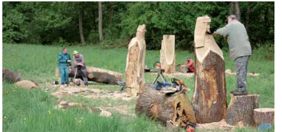
REZBÁRSKE SYMPÓZIUM SA V MÁJI KONALO AJ VO ZVOLENE. NA PUSTÝ HRAD PRIBUDLI SOCHY KRÁĽOV.