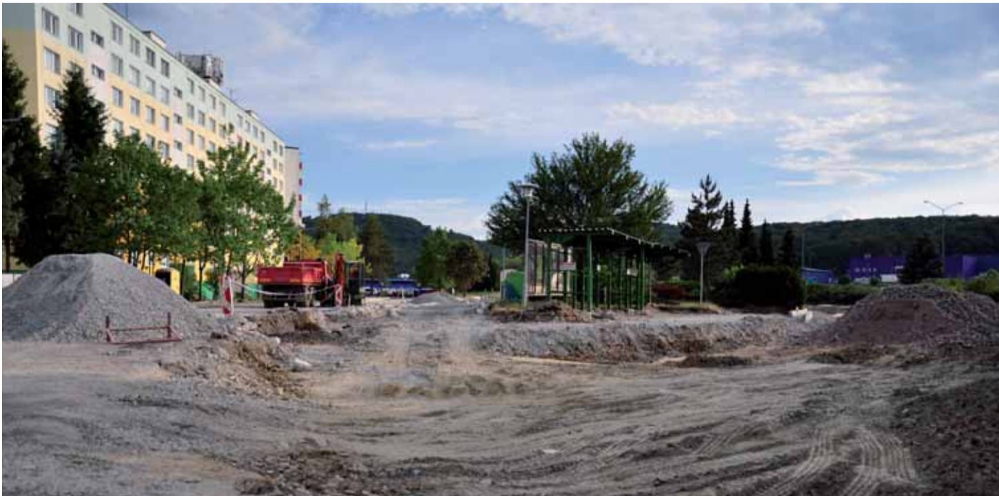
V LETE MESTO DOKONČÍ SVOJU NAJVÄČŠIU INVESTÍCIU - TULSKÚ UL. V HODNOTE TAKMER 900 000 EUR. OKREM TOHO BY SA MALA REKONŠTRUOVAŤ DOBRONIVSKÁ CESTA, CHODNÍKY NA ŠTUDENTSKEJ UL., GAGARINOVEJ UL., UL. GENERÁLA SVOBODU, UL. BRATOV VESELOVCOV, UL. MATEJA BELA, UL. PRIBINOVEJ A MNOHÉ INÉ.