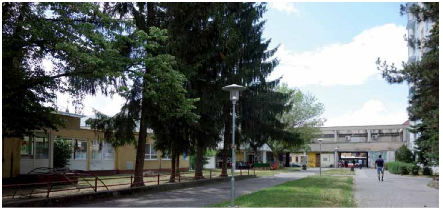
VNÚTROBLOK HRNČIARSKA UL. - BYSTRICKÝ RAD - UL. J. KOZÁČEKA.

Rekonštrukcia materskej a základnej školy Hrnčiarska je dobrou príležitosťou zamyslieť sa nad celým priestorom. Mesto uvažuje o rekonštrukcii tzv. „vnútrobloku“ a zapája sa do ďalšej výzvy IROP-u. „Predmetom riešenia